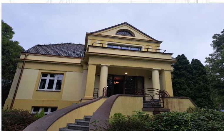
▪ Fundacja Rozwoju Miasta Poznania