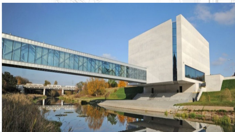
▪ ICHOT Brama Poznania