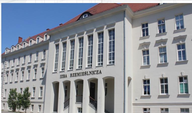
▪ Izba Rzemieślnicza